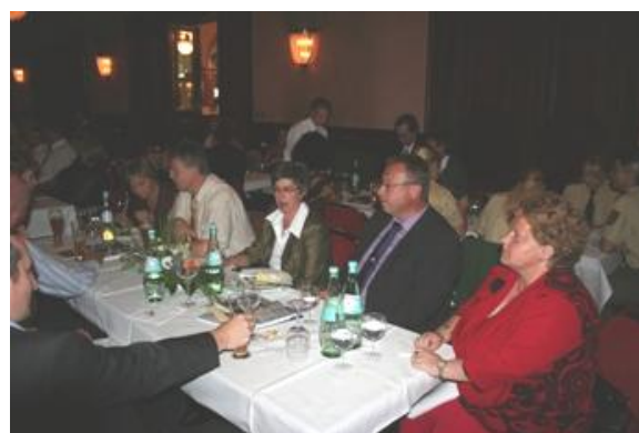
(Galaabend im Kongresshaus Stadthalle HD)

Am Ende des Landesdelegiertentags versäumte die Versammlung fast noch den nächsten Veranstaltungsort im Jahr 2011 zu bestimmen. Es bewarben sich zwei Verbindungsstellen für die Ausrichtung, wobei in Vorgesprächen die andere Verbindungsstelle Wiesensteig den Vortritt ließ, nachdem dort der Landesdelegiertentag mit der 50-Jahr-Feier kombiniert werden soll. Somit konnten die Delegierten im Stehen den Veranstaltungsort 2011 ohne vorherige Aussprache absegnen.